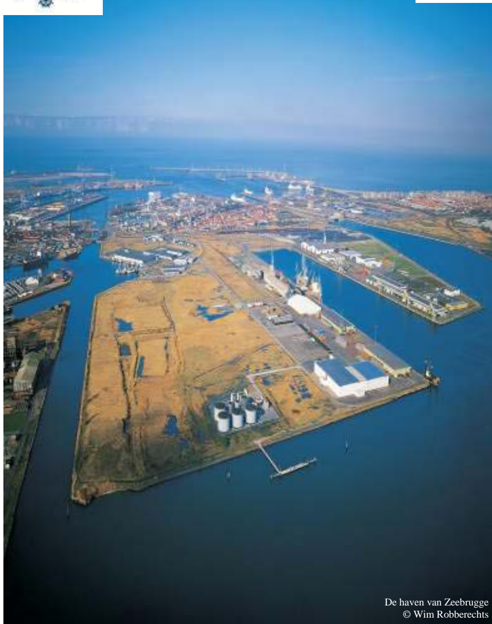
De haven van Zeebrugge