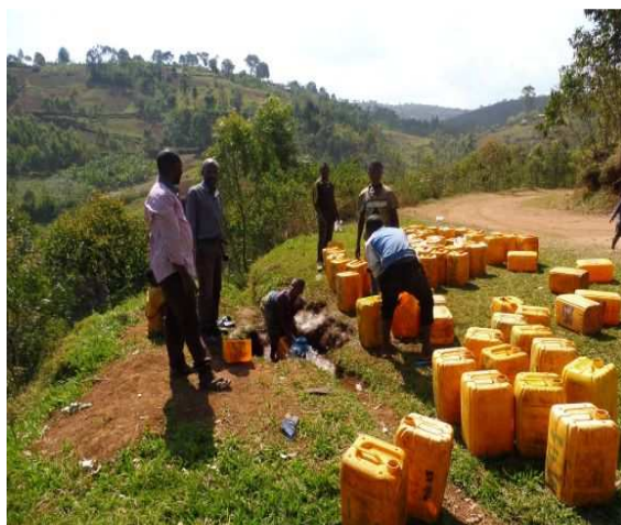
Clandestins s'approvisionnant sur une conduite trouée après travaux de d'ouverture de piste

On relève, au Kivu nombre d'intervenants avec un manque de coordination des actions de développement, ci-dessous un exemple lors de travaux d'ouverture de pistes lancés par la Province sans s'assurer préalablement de la présence de canalisations au réseau de Cishado.