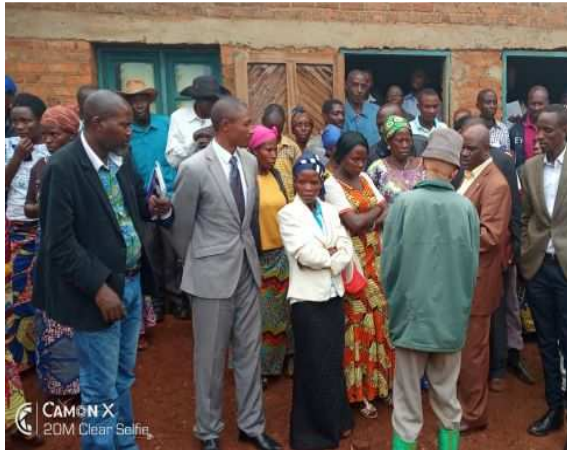
Délégués à l'AGED Lujambo.