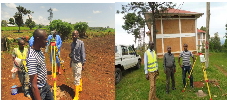
Levées topographiques source Kamira 2 du réseau de Mwendo Mudaka jusqu'aux bâtiments de l'UCB