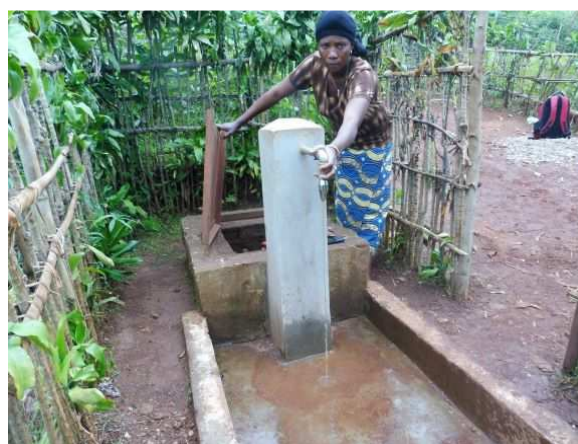
BF n° 15 du réseau de Nduba réhabilitée