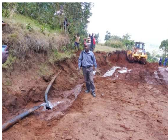
Travaux de réhabilitation de la RN 2, mettant en péril l'adduction de l'ASUREP Cishado

Sur le plan sanitaire, les cas de choléra ont été enregistrés à travers toute la province du Sud Kivu zone endémique traditionnelle.