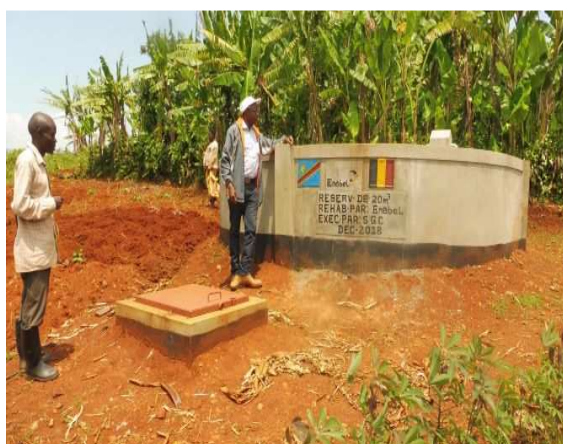
Réservoir 20 m 3 du réseau Nduba

A ce stade les activités sont essentiellement liées aux études et constats sur l'état des réseaux souvent complexe et sous dimensionnés, avec des conduites non adaptées aux pressions de manière générale.