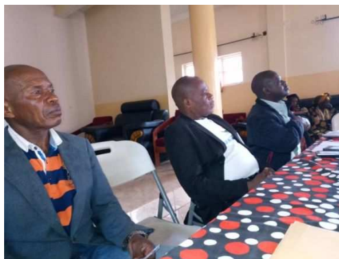
L'administrateur du territoire (AT) de Walungu et le Délégué du Mwami de Walungu lors de la journée de lavage des mains devant le grand public et forces vives du territoire.

A noter, lors de la Journée Mondiale des Toilettes pour la promotion de bonnes pratiques de lavage des mains, deux caravanes organisées sur toute l'étendue des réseaux de Nduba et de l'île d'Idjwi, avec implication des autorités politico - administratives de ces entités. A Nduba, on a noté la présence des délégués de Cishadu, Lujambo et Mwendo Mudaka. A Idjwi par contre, les 3 ASUREP ont fait parties de la caravane. On a enregistré une affluente de la population, singulièrement des femmes et des jeunes, aussi des membres de dites ASUREP et ceux des zones de santé de ces sites d'intervention. Par la même occasion, les ASUREP ont été dotées des mégaphones de sensibilisation pour la continuité de l'action.