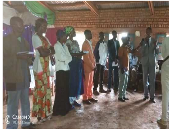
Le Chef de Poste donnant les conseils aux élus au CA

Concernant l'analyse des points d'eau utilisés, les analyses aux sources, ainsi que sur quelques BF sont toutes conformes. Le débit généralement peu variable au cours de l'année montre une très faible vulnérabilité.