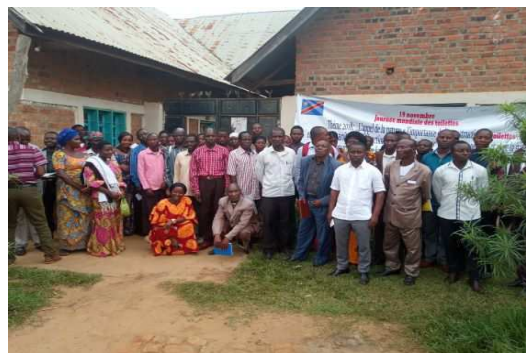
Ci-dessus A Idjwi, la sensibilisation au lavage des mains des délégués des ASUREP et d'autres participants devant l'AT & le délégué du Mwami Rubenga