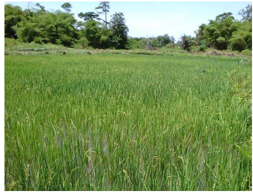
Riziculture de bas-fonds (Bassin Banalia-Centre)