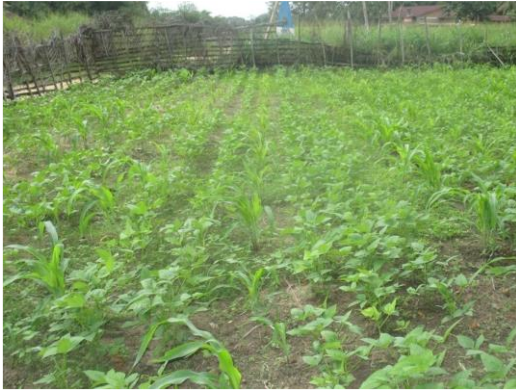
Application de l'association céréale- légumineuse et semis en ligne au niveau d'un ménage à partir du CEP voisin (Bassin Opala-Centre)