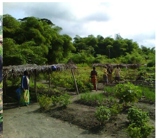
Périmètre horticole Maman Molende (Bassin Kombe- Antenne Isangi)