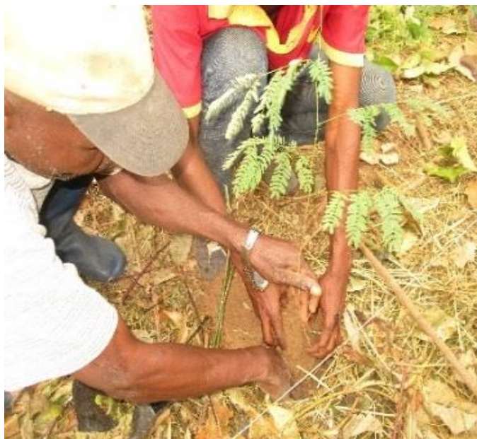
Appui-conseil au champ par STD

Dans le cadre du partenariat avec le SENASEM, des inspecteurs semenciers ont été déployés dans les bassins de production. Leur présence régulière auprès des producteurs de semences contribue à renforcer les compétences de ces derniers en technologie semencière. La relation entre le service de contrôle des semences et le producteur évolue aussi, par ce biais : d'une position de contrôleur de la semence, le SENASEM est de plus en plus perçu par le producteur comme aussi le conseiller en matière de semence.