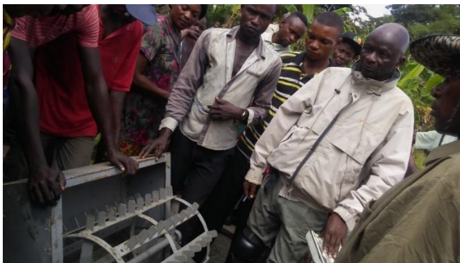
Mise à disposition de batteuses manuelles aux OP

Néanmoins, l'écoulement des productions demeure fortement lié à la problématique du désenclavement. En accord avec PRODAT, PRODET envisage de revoir son approche en prônant la multimodalité (nombreux cours d'eau navigables dans la Tshopo) et l'entretien local (au niveau des routes de desserte agricole).