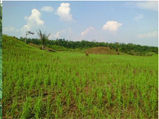
Champ semencier de riz pluvial (Bassin Babelota – Antenne Isangi)