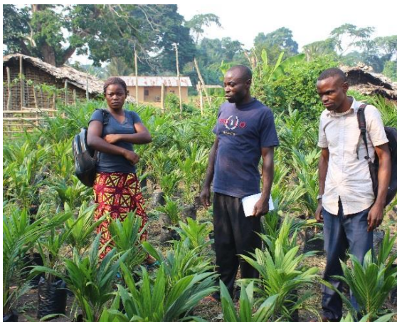
Pépinière de palmiers à huile (bassin Yaongendja – Antenne Yatolema)