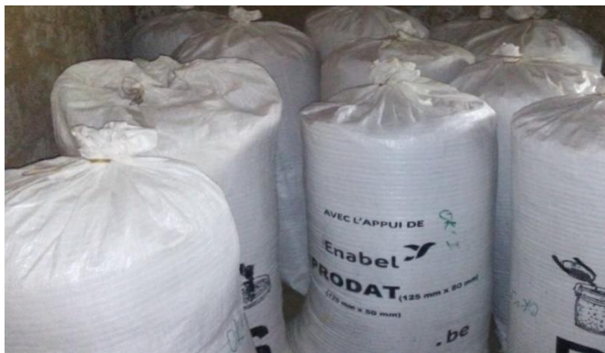
Conservation des productions en sacs PICS