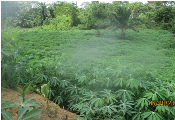
Parc à bois à Bambaye (Bassin Bayaswa – Antenne Bengamisa)