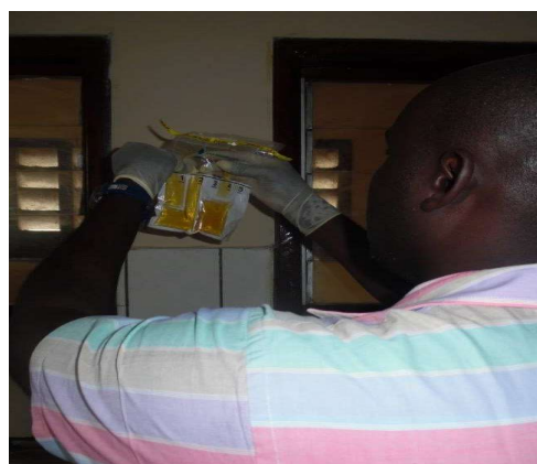
Figure 1. Kit d'analyse en cour de test

Concernant la Convention de délégation du service public de l'Eau (DPSE) entre l'ASUREP et l'Entité Territoriale Décentralisée (ETD), ici la commune, tous ces documents ont été rédigés et validés avec le Ministère de Développement rural pour remise aux autorités provinciales afin d'une appropriation locale. L'objectif recherché étant d'assurer un cadre réglementaire stable, définissant clairement les responsabilités de chacun, notamment en termes de propriétaire des infrastructures, modalités de gestion, ce processus indispensable est en cours d'avancement.