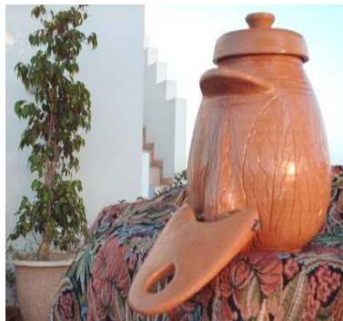
Type de système de lavage des mains sans manipulation de robinet prévu d'être dupliqué : Canacla (Canari à Clapet)