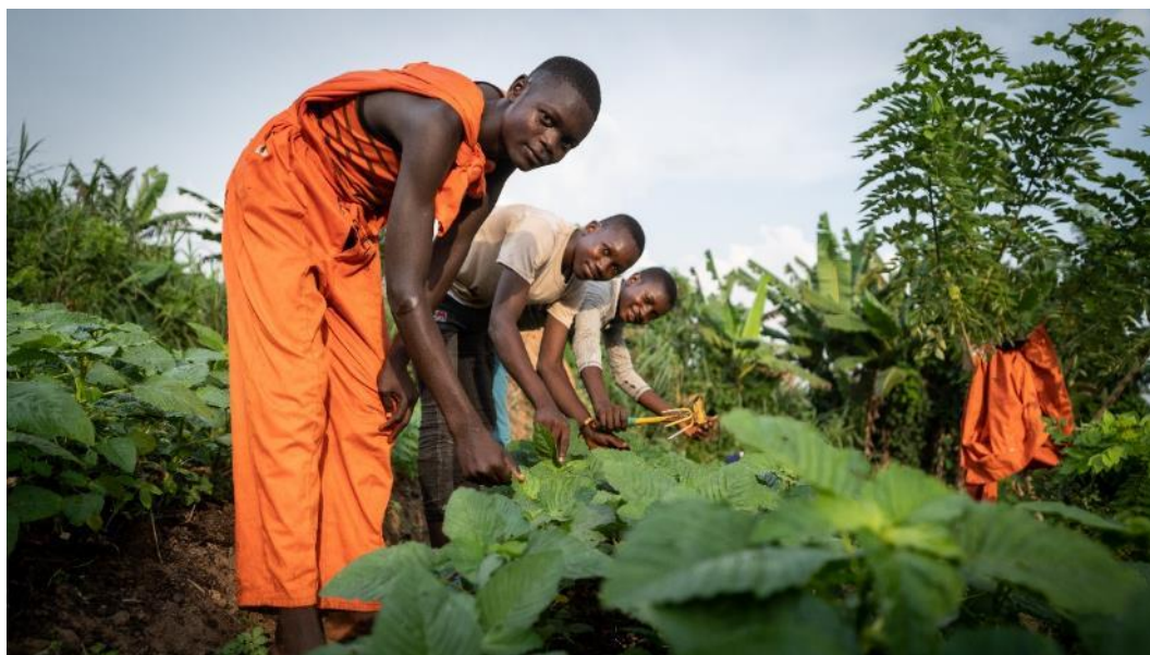
Travaux pratiques élèves ITA Gwaka dans le potager scolaire (Asbl ELIKYA)