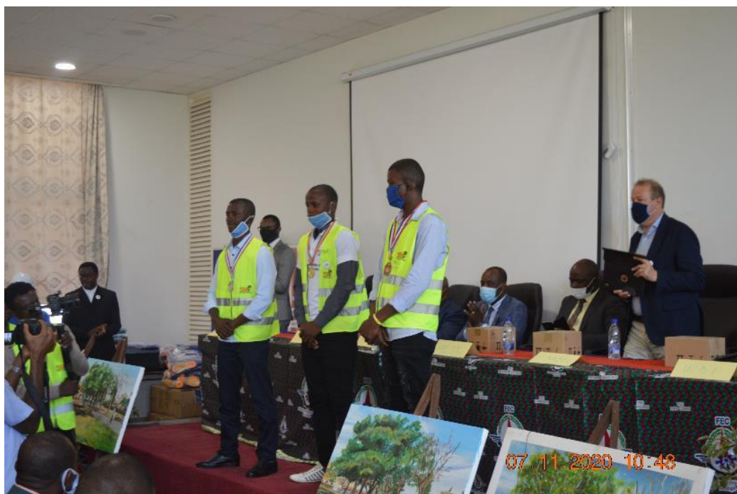
Cérémonie de remise des médailles SMF 2020 à Lubumbashi.

Comme facteurs positifs, il faut mentionner la diversification d'offre de formation courte durée qualifiante (fonderie, forge, briqueterie, menuiserie, pâtisserie...) Facteurs négatifs : Déficit des formateurs qualifiés dans la région.