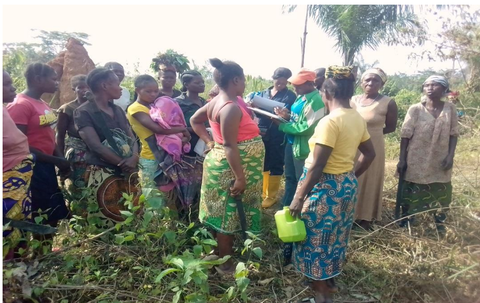
Insertion femmes dans les cultures vivrières à Gwaka.

Les détails des personnes accompagnées par filière dans le tableau ci-après :