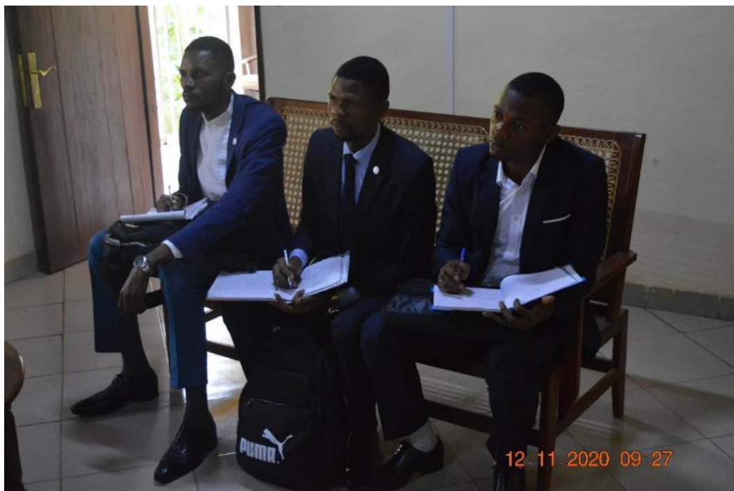
Séance briefing trois stagiaires ENA à Gemena (01 PADP et 02 EDUMOSU)