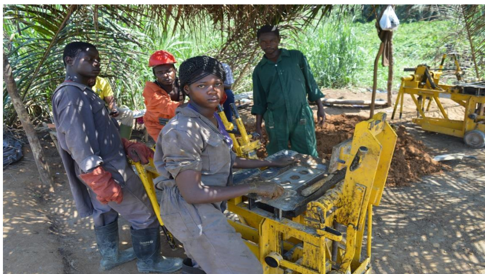
Jeunes briquetiers en insertion sur chantier réhabilitation Budjala.

Le nombre d'insérés va être amélioré car le projet a mis en place deux approches : (1) Un dispositif d'incubation urbain va être appuyé pour offrir des services diversifiés aux jeunes entre autres l'insertion et (2) l'Asbl ELIKYA, incubateur rural, a reçu des fonds additionnels qui vont permettre une mise à l'échelle des résultats obtenus dans la première CSUB.