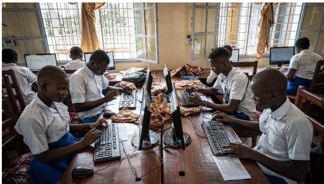
Jeunes en cours pratique en informatique au CS Th. Verbist.

Ce tableau reprend automatiquement la synthèse des indicateurs pour le niveau output mis à jour dans Pilot.