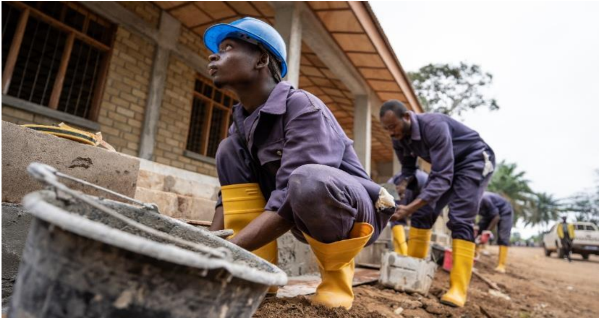
Jeune en insertion au chantier Ecole Budjala.