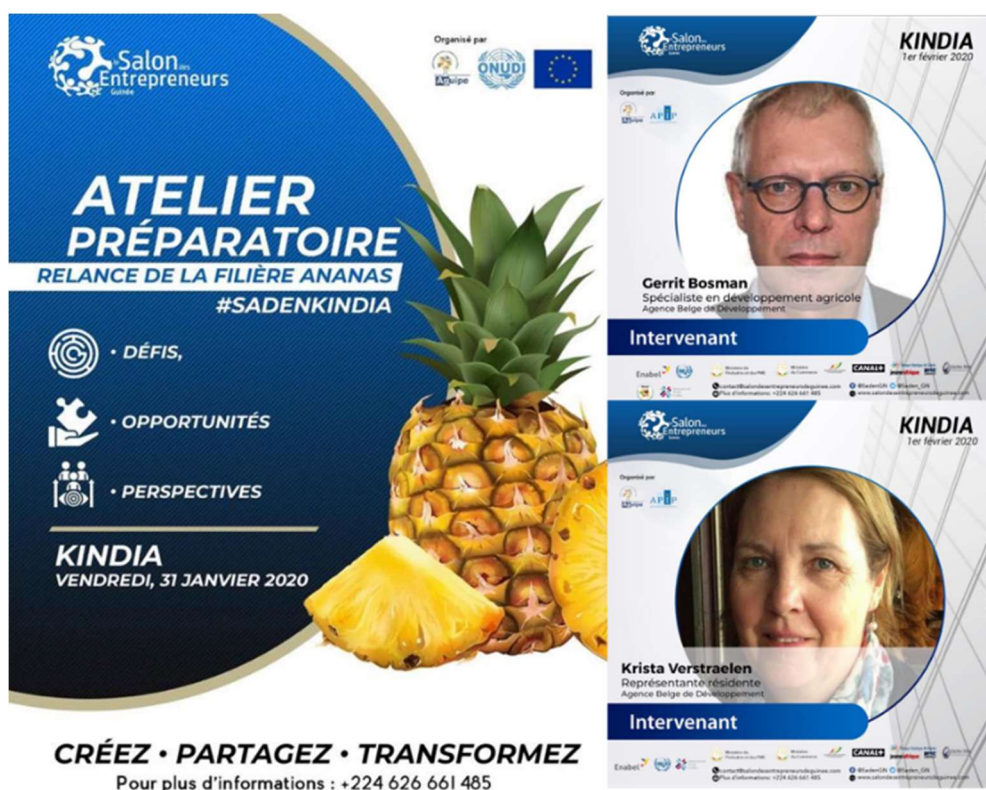
Supports de communication développés dans le cadre du SADEN de Kindia – 1 er Février 2020

l'innovation passe également par l'émergence de clusters compétitifs. Les activités conduites dans le cadre des études de démarrage ont permis plusieurs avancées, à savoir : i) l'identification de clusters porteurs – Hospitalité & Tourisme, Ville Durable et Digital, ii) la tenue de premiers échanges en lien avec la mise en œuvre du contenu local au sein du cluster tourisme, iii) de premières réflexions autour de compétitions entrepreneuriales pouvant promouvoir l'innovation au sein des filières en lien avec la gestion des déchets ou la promotion du tourisme. Le développement de ces clusters représente un fort potentiel d'innovation et de lien d'affaires entre PME et grandes entreprises. Ces éléments constituent des priorités pour 2020.