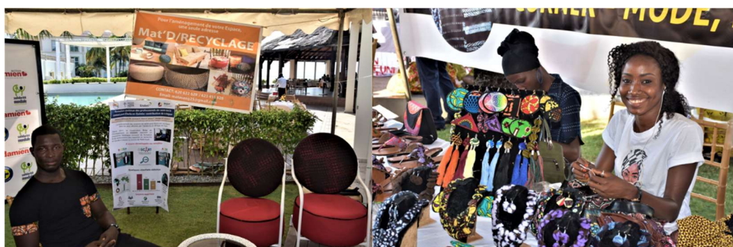
Stands d'exposants organisés par clusters lors de la Journée Belge du 15 Novembre 2015 – Economie circulaire / Mode & Design

l'innovation passe également par l'émergence de clusters compétitifs. Les activités conduites dans le cadre des études de démarrage ont permis plusieurs avancées, à savoir : i) l'identification de clusters porteurs – Hospitalité & Tourisme, Ville Durable et Digital, ii) la tenue de premiers échanges en lien avec la mise en œuvre du contenu local au sein du cluster tourisme, iii) de premières réflexions autour de compétitions entrepreneuriales pouvant promouvoir l'innovation au sein des filières en lien avec la gestion des déchets ou la promotion du tourisme. Le développement de ces clusters représente un fort potentiel d'innovation et de lien d'affaires entre PME et grandes entreprises. Ces éléments constituent des priorités pour 2020.