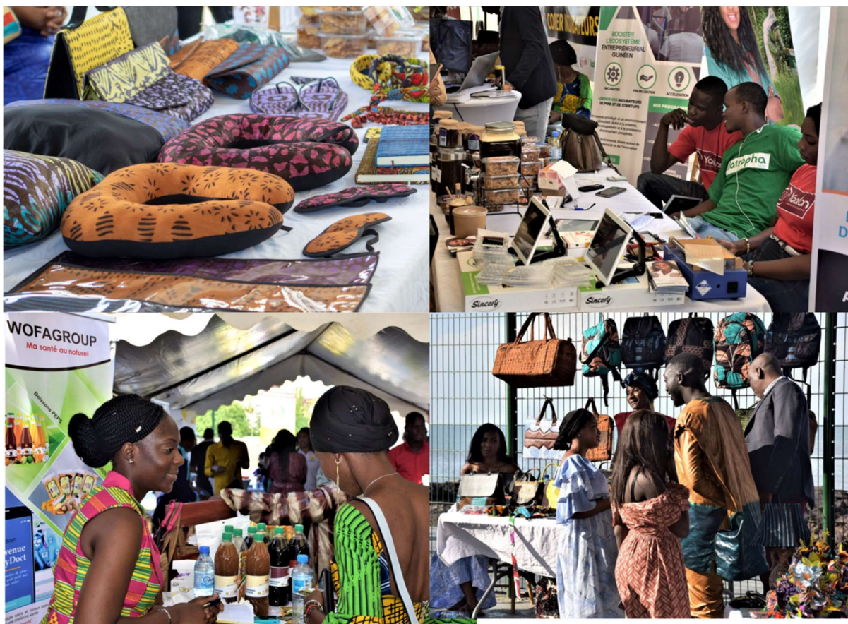
Foire-Expo organisée pour la Journée Belge – 15 novembre 2019