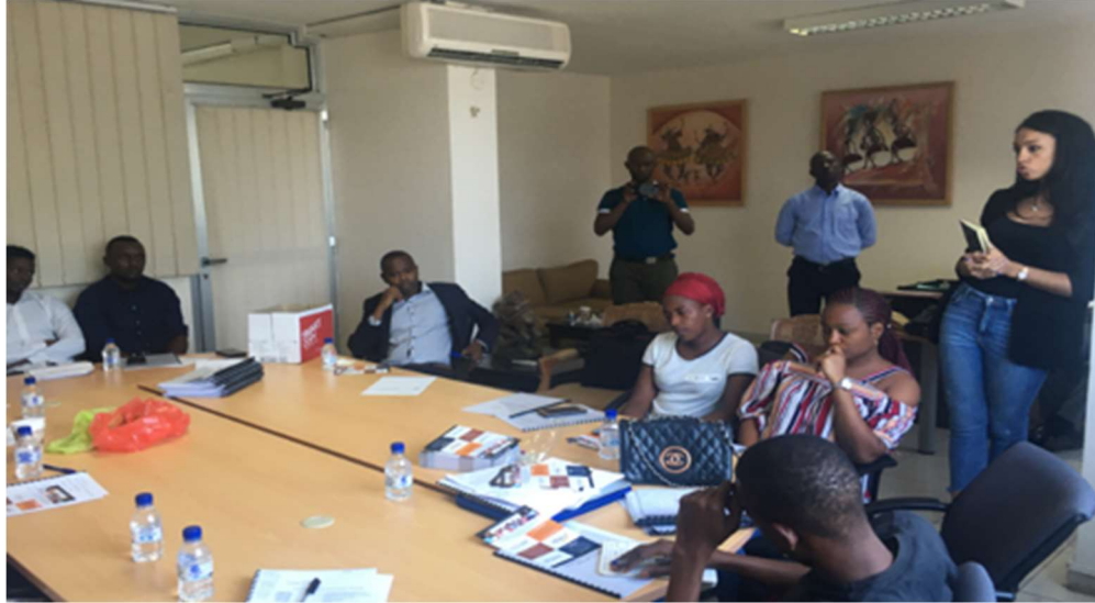
Session de briefing des agents en charge de l'enquête de caractérisation des MPME cibles

En complément de cette approche visant à prioriser les MPME cibles, un travail de priorisation des filières a également été entamé. L'enjeu est d'identifier des clusters 3 à fort potentiel en termes de développement économique et social pour la Guinée et de mettre l'accent sur le développement de ces filières dans la cadre de l'intervention. Les travaux en cours visent à identifier des chaînes de valeur porteuses au sein des clusters i) Hospitalité & Tourisme, ii) Ville Durable, iii) Digital. Ces clusters ont notamment été retenus sur la base de leur potentiel impact en termes de création d'emplois et d'inclusivité, de la faisabilité économique (existence d'une demande, d'un tissu de MPME) et de l'alignement stratégique avec les priorités d'Enabel et du Gouvernement guinéen.