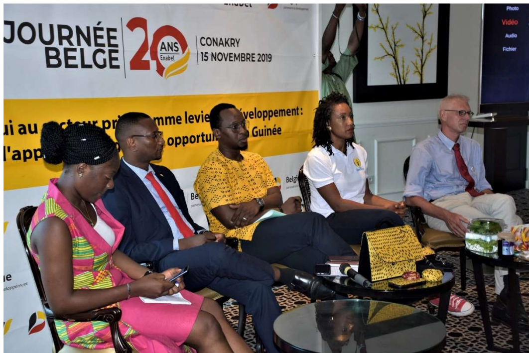
Panel organisé lors de la Journée Belge sur le thème « L'appui au développement du secteur privé comme levier de développement : l'approche belge et les opportunités en Guinée »

Le plein engagement de l'APIP dans les activités d'identification des SAE en Guinée représente également une opportunité importante. L'APIP se positionne en effet comme une structure pérenne pour favoriser les échanges entre les principaux incubateurs, en complément de la dynamique d'organisation en Faire. L'APIP se positionne également comme une SAE publique qui vise à proposer des services d'accompagnement post-crédit de qualité aux entreprises guinéennes. L'opportunité de développer une Convention de subside en octroi direct avec cette structure fait partie des priorités de 2020.