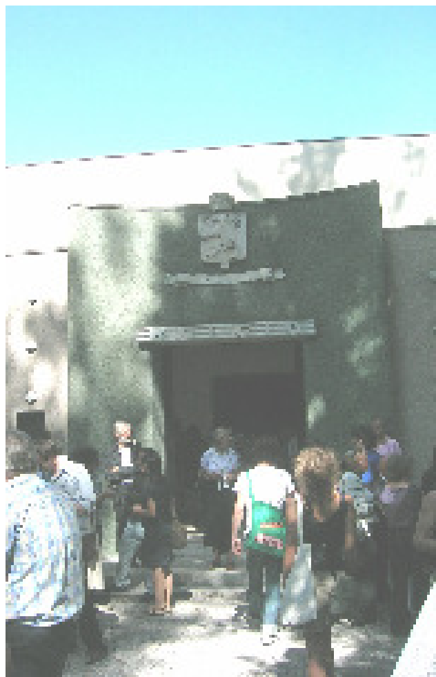
Il padiglione belga alla Biennale di Venezia

Ambasciata del Belgio Via dei Monti Parioli, 49 00197 ROMA Tel. 06.36.09.511—Fax 06.322.69.35 E-mail: ambelrom@tin.it Website: www.diplomatie.be/romeit/